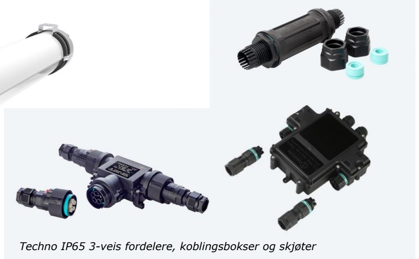
Techno IP65 3-veis fordelere, koblingsbokser og skjøter