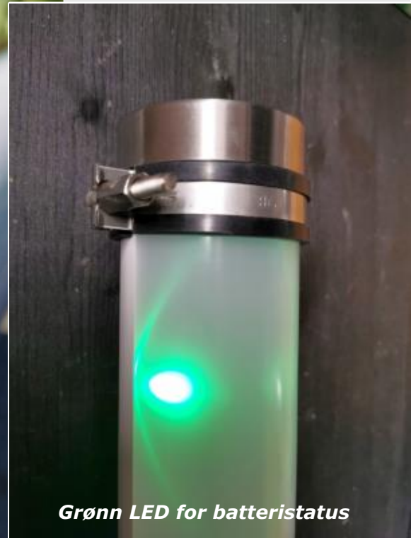
Grønn LED for batteristatus