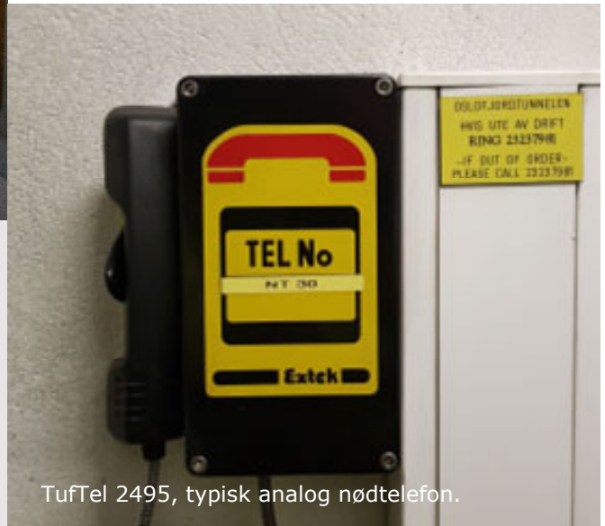
TuFTel 2495, typisk analog nødtelefon.

Crescendo er i utgangspunktet IP/SIP basert og analoglinjene håndteres via IP-Analog adaptere. En stor fordel med valgt løsning er at det er mulig å justere nivå for hver enkelt analoglinje.