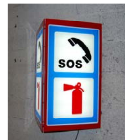
Kombineres med HDS-V plogskilt