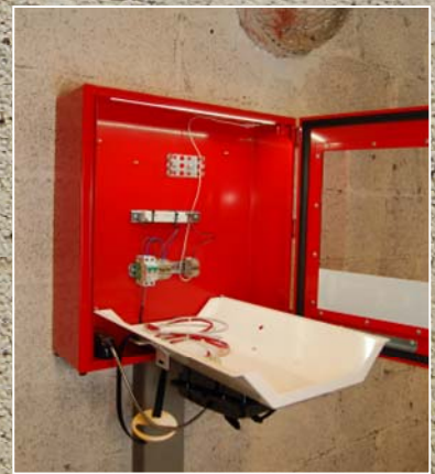
Teknisk rom bak skillevegg

Mest kompakte nødstasjon på markedet – dybde kun 22cm