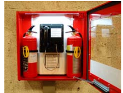
Plass for to brannslukkere og nødtelefon

T-skapet fås i to størrelser , 300x650mm eller 650x650mm, begge med montasjeplater.