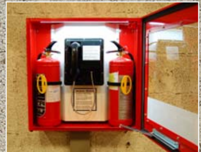
Plass for to brannslukkere og nødtelefon