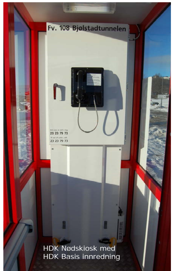
HDK Nødkiosk med HDK Basis Innredning

Med tanke på plassering av nødtelefoner, PLS, remote I/O, videoservert og annen elektronikk kan kioskene utstyres med innvendige HDK kioskinnrøddinger . Disse leveres i to størrelser, "Basis" (60cm bredde) og "Extended" (70cm bredde), begge med mulighet for nødstyrepånel og ulike typer av låsing. Innredningen består av teknisk skap og bunnseksjon , der bunnseksjonen gir plass for kabler, fiberbokser og annet koboingsmateriell.