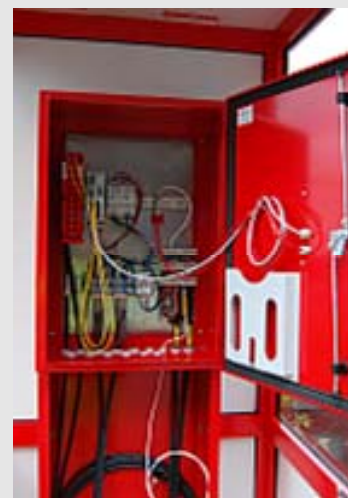
Teknisk skap med plass for fiberpanel, nettverk og elektro