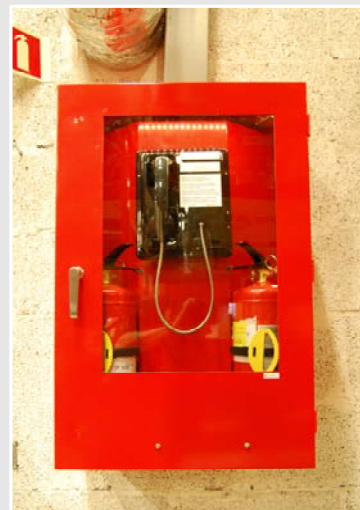
LED Stripe i nødskap

Catena HDL LED er en robust og kraftig lyskilde beregnet for bruk i røffe miljø. Den benyttes frittstående eller kobles i kjede der det er behov for mer lys eller for å dekke et større område. De store fordelene med LED er lang levetid (>50.000 timer), lavt effektforbruk og meget kompakte mål, noe som gjør LED svært godt egnet i industrimiljø. Armaturene monteres via medfølgende festklips eller med borrelås.