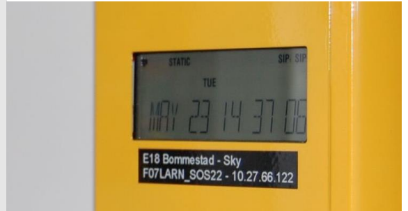
Servicedisplay på bakside av telefon (innfelling)