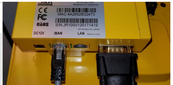
Pluggbare tilkoblinger på bakside av telefon (innfelling).