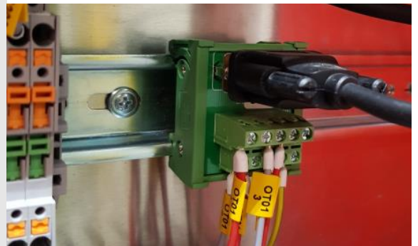
DB9-Rekkeklemme adapter for DIN skinne