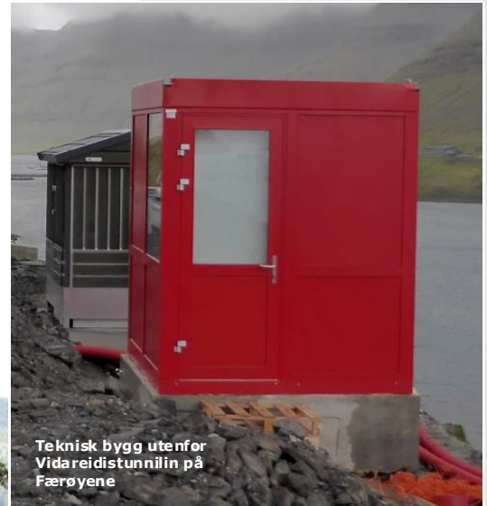
Teknisk bygg utenfor Vidareidstunnilin på Færøyene