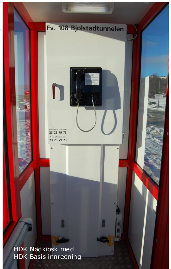
HDK Nødkiosk med HDK Basis innredning