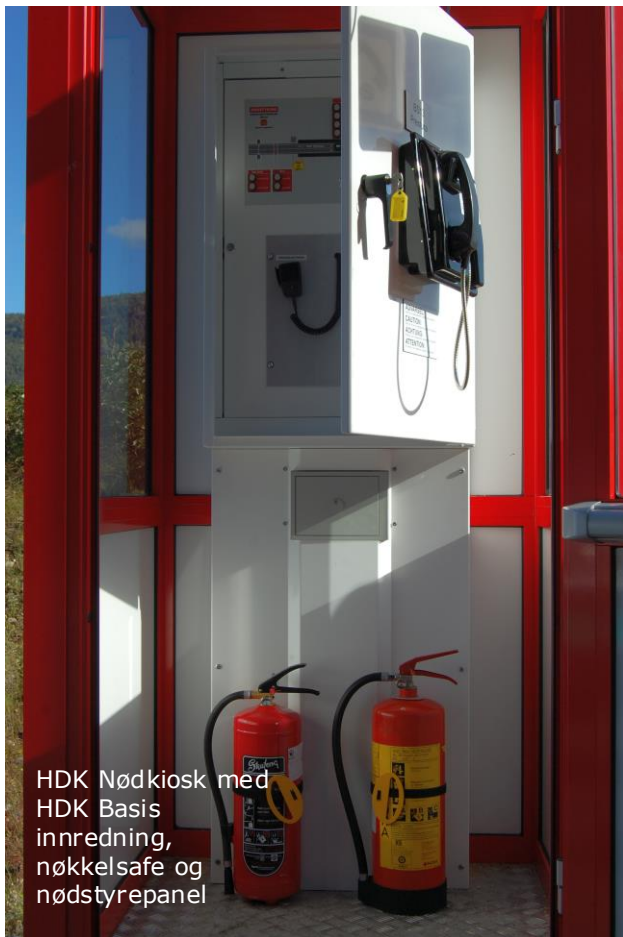
HDK Nødkiosk med HDK Basis innredning, nøkkelsafe og nødstyrepanel

Med tanke på plassering av nødtelefoner , PLS, remote I/O, videoservere og annen elektronikk kan kioskene utstyres med innvendige HDK kioskinnredninger . Disse leveres i to størrelser, "Basis" (60cm bredde) og "Extended" (70cm bredde), begge med mulighet for nødstyrepanel og ulike typer av låsing. Innredningen består av teknisk skap og bunnseksjon , der bunnseksjonen gir plass for kabler, fiberbokser og annet koblingsmateriell.